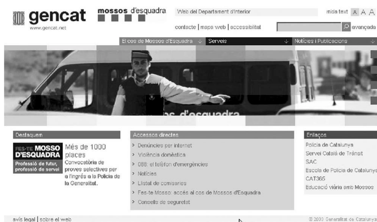
Web del Cos de Mossos d'Esquadra

Preceptiva la seva creació en tots aquells municipis que tinguin policia local (en ocasions denominada policia municipal, guàrdia urbana o altres de tradicionals). Es constitueix com un òrgan col·legiat de col·laboració i coordinació general dels diversos cossos de policia i altres serveis de seguretat que operen en el seu terme municipal i de participació ciutadana en el sistema de seguretat.